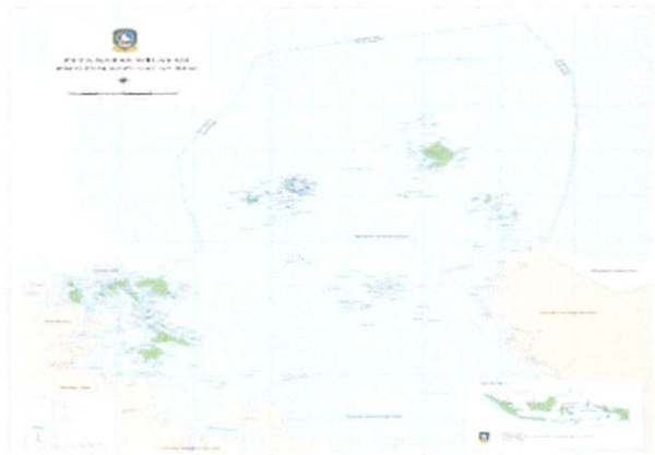
Pulau Belakang Padang (Kelurahan Tanjung Sari dan Kelurahan Sekanak Raya)